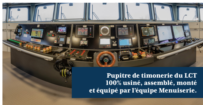
Pupitre de timonerie du LCT 100% usiné, assemblé, monté et équipé par l'équipe Menuiserie.