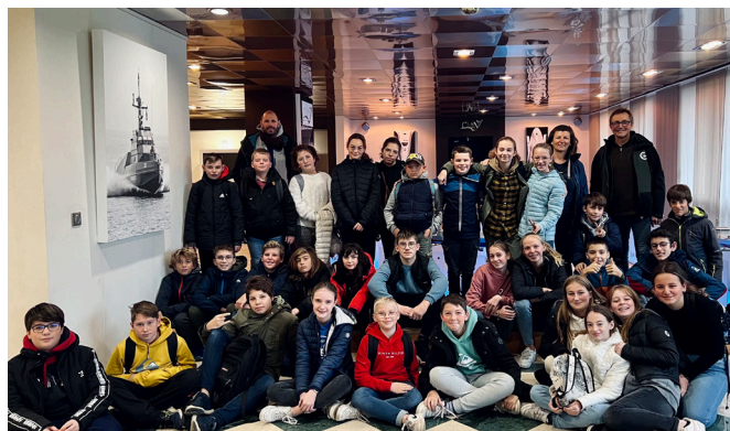
Du 21 au 25 novembre a eu lieu la semaine de l'industrie. Au total, plus de 120 collégiens, lycéens et demandeurs d'emploi ont pu visiter notre site et échanger avec des salariés.