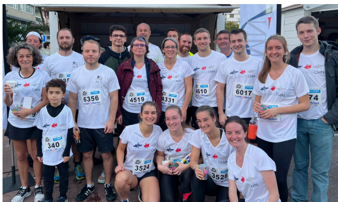
Le 11 novembre dernier, pas loin de 30 coureurs de l'ÉQUIPAGECMN se sont élancés pour la 40e édition des Foulées de la Presse de la Manche.