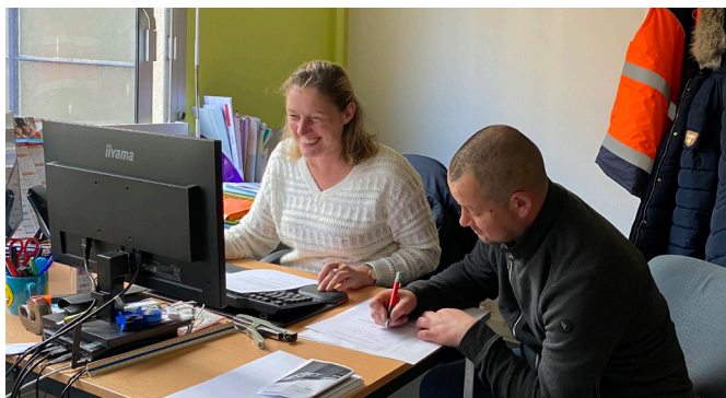
À l'occasion du DuoDay, toujours dans le cadre de la SEEPH, nous avons pu accueillir une personne en situation de handicap, pour une journée d'immersion au poste de « chargé de prévention ».