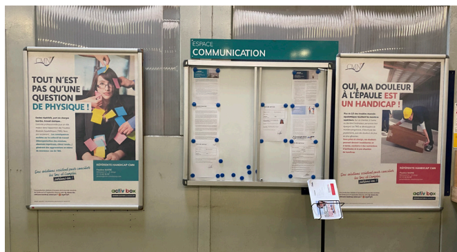
Du 14 au 18 novembre s'est déroulée la Semaine Européenne de l'Emploi des personnes en Situation de Handicap. Semaine dans laquelle CMN s'est engagé avec plusieurs actions de sensibilisation.