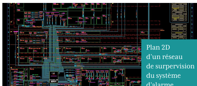
Plan 2D d'un réseau de supervision du système d'alarme.

En parallèle, l'équipe réalise l'aménagement et la coordination des zones, pour assurer l'intégration de l'ensemble des équipements et des réseaux les parcourant en évitant toute interférence.